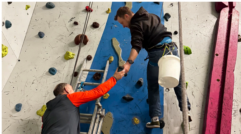
Schrauben im Kletterraum, 16.01.2025