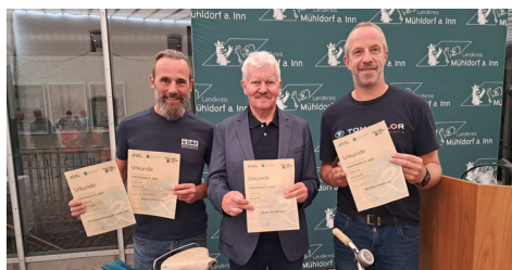
Siegerehrung Stadtradeln, 13.07.2025