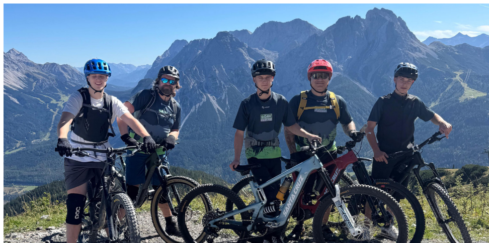
Ausfahrt in den Bikepark Lermoos-Biberwier, 20.09.2025