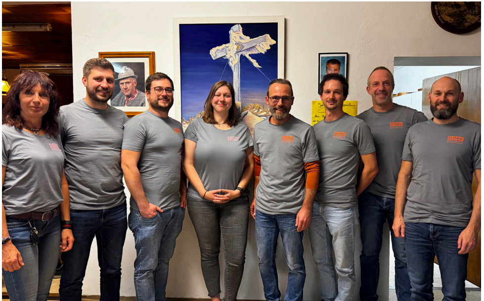
Unsere Vorstandschaft, gewählt von der Jahreshauptversammlung am 14.11.2025