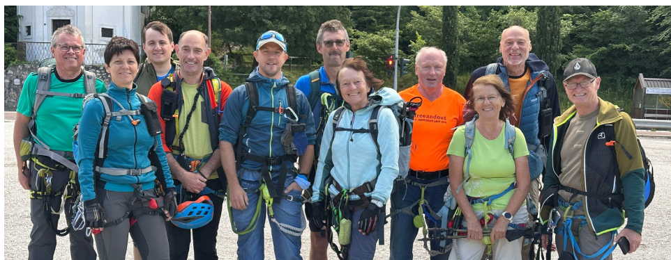
Klettersteige im Trentino, 29.05.2025