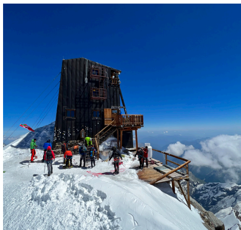
Hochtour Monte Rosa, 08.07.2023