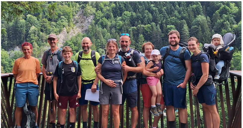
Kind-Kegel-Kraxe Wanderung, 06.07.2025