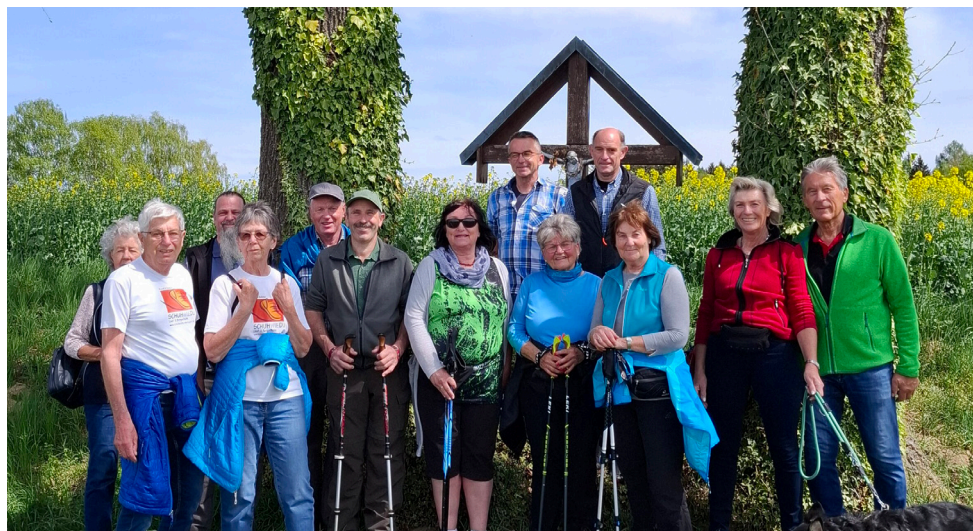
Osterwanderung in unserer Heimat, 21.04.2025