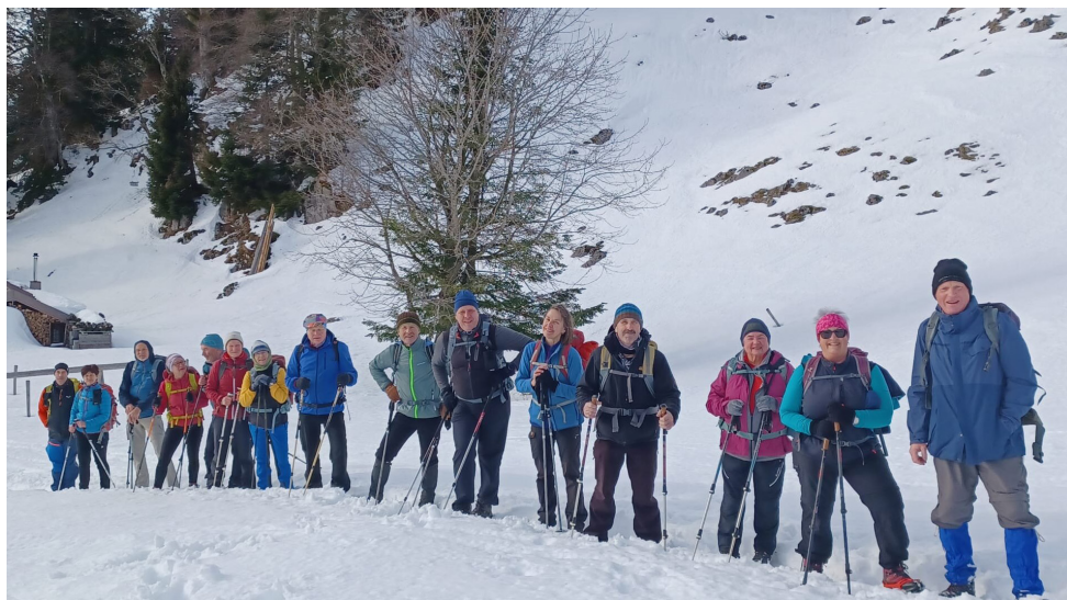
Schneeschuhtour auf den Laubenstein, 06.01.2025

Die Kontaktdaten zu den Tourenbegleitern findet ihr auf Seite 8.