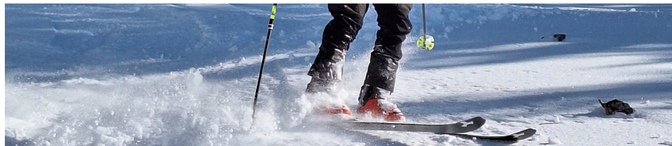
Skitour zum Kleberkopf, 02.02.2025