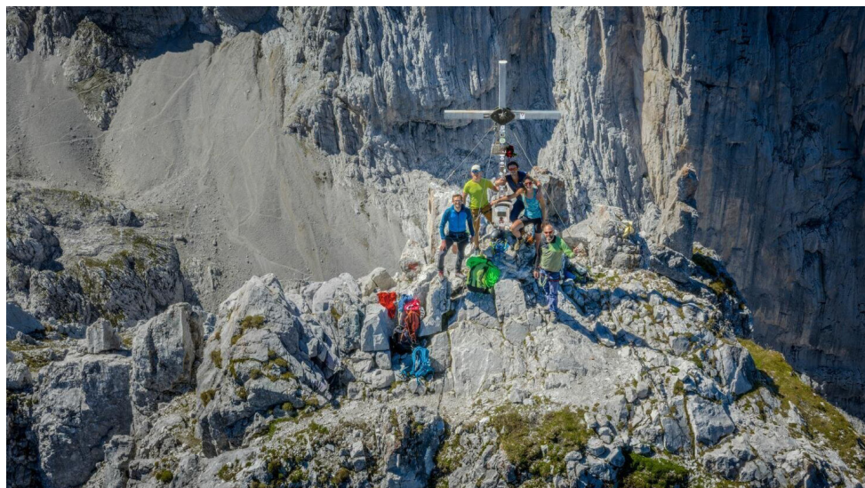
Alpine Klettertour zur Hinteren Goinger Halt (Über den Nordgrat), 31.08.2025