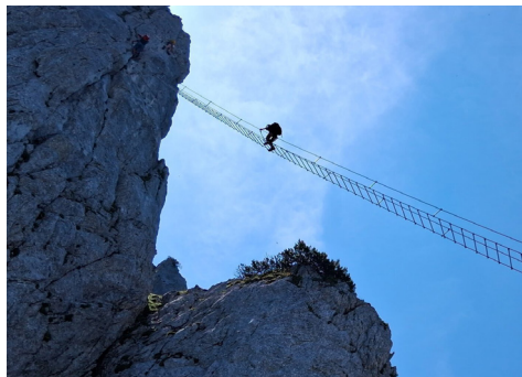
Himmelsleiter & Donnerkogel, 20.07.2025