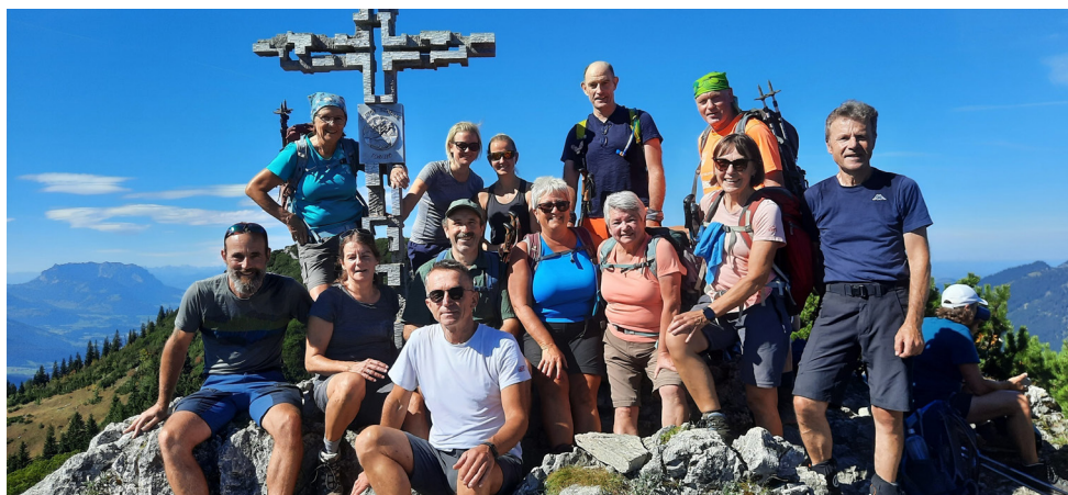
Wanderung zur Hörndlwand, 21.09.2025

Die Kontaktinformationen der Tourenbegleiter aus dem Vorstand sind auf Seite 2 zu finden!