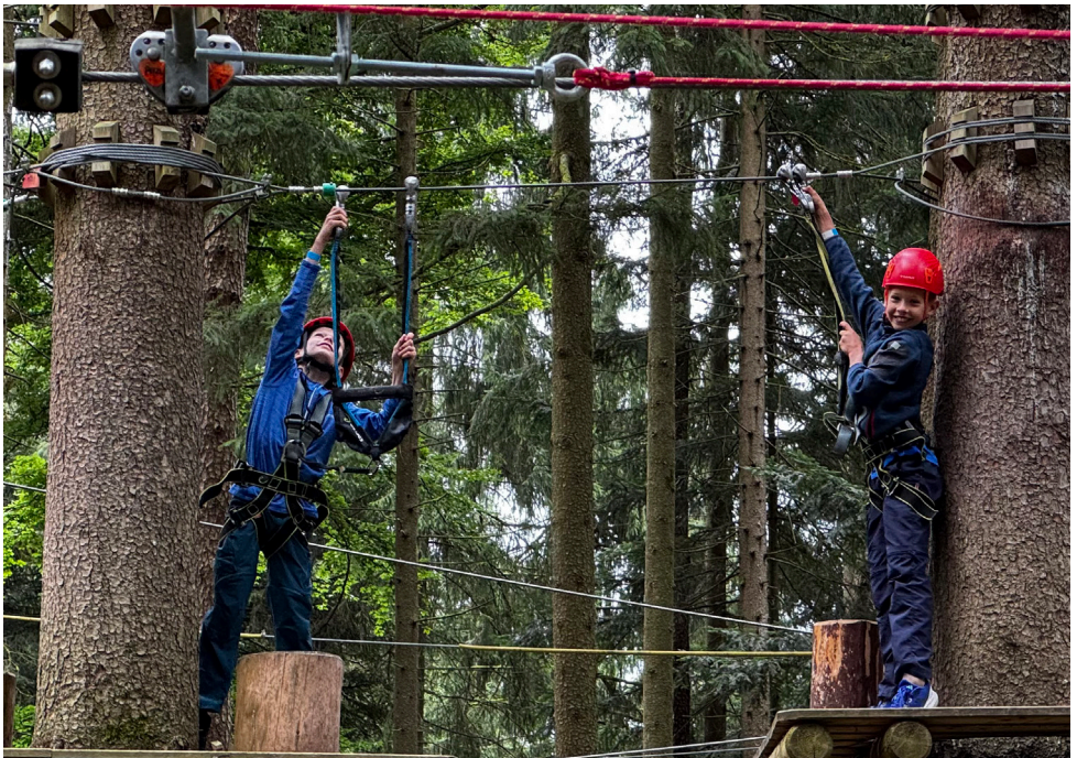
Ausflug in den Waldseilgarten Oberreith, 23.08.2025

Termine werden intern in den Klettergruppen bekannt gegeben.