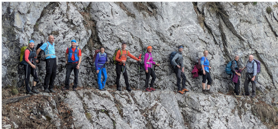
Tour zur Vorderkaiserfelden Hütte, 23.03.2025